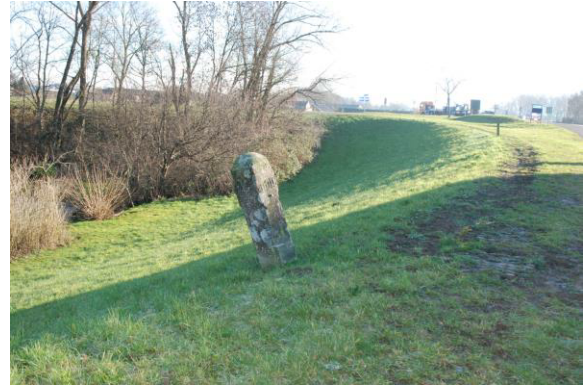
Graaf Reinald Alliantie

Opmerking De bescherming van de ondergrond beperkt zich tot de directe omgeving rond de paal (.a. 1 m2).